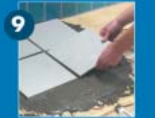
Már burkolhat is!