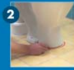
Jelölje meg a WC, vagy egyéb elmozdításra kerülő berendezés helyét, úgy, hogy a fektetésnél ezek alá ne kerülhessen fűtőszál.