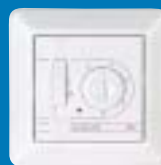
devireg 520 süllyesztett kivitel