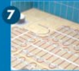
Miután a szőnyeget a kívánt helyzetbe fektette, távolítsa el a védőfóliát, és rögzítse a szőnyeget a padlóra.