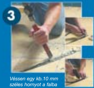
Vésszen egy kb. 10 mm széles hornyot a falba a termosztát helyétől a padlóig, majd onnan kb. 1 m távolságra a padlóban. Rögzítsen a hornyokban egy műanyag csövet, melyben elhelyezhető a termosztát érzékelője.