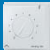
devireg 130 falon kívüli