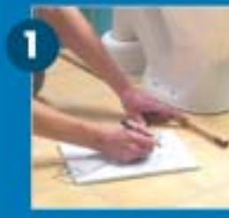
A fűtendő terület kiszámítása és a szőnyeg kiválasztása után készítsen egy fektetési vázlatot.

Danfoss Kft H-1139 Budapest, Váci út 91. Tel.: 06-1-450253-1 Fax: 06-1-450253-9 www.devi.hu hungary@devi.com