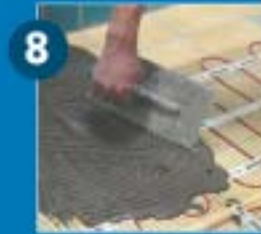
Ezután folyamatosan terítse be azt flexibilis csemperagasztóval.