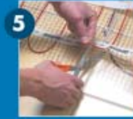
A szőnyeg terítésekor a fordulóponthoznál vágja el a műanyag hálót, de vigyázzon ne hogy megsértse a kábelt!