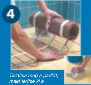
Tisztítsa meg a padlót, majd terítse ki a szőnyeget.