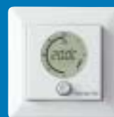
devireg 550 intelligens, programozható