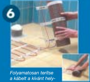
Folyamatosan terítse a kábelt a kívánt helyzetbe, ahogyan azt előre tervezte.