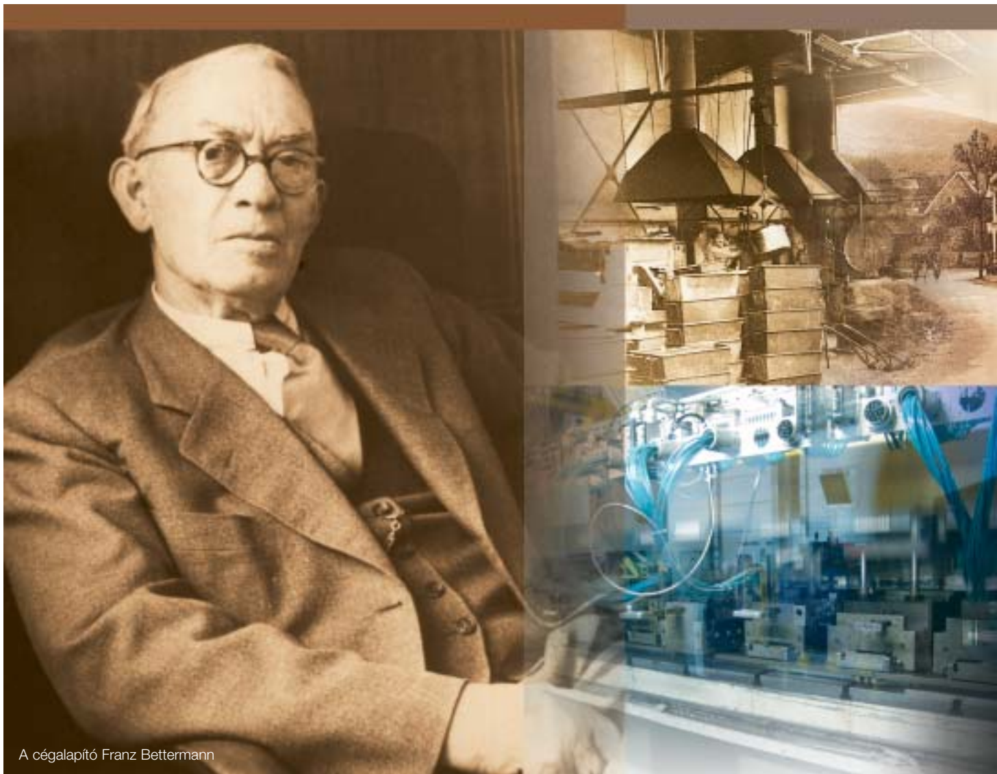
A cégalapító Franz Bettermann

Akkor van itt az ideje a következő lépés megtételének, amikor már sokat elértünk. Ez a rugalmasság határozza meg cégünk filozófiáját már csaknem száz éve és ez garantálja, hogy ugyanilyen keményen fogunk dolgozni a jövőben is: vállalatunk és az Ön sikeréért. Ez az, ami összeköti a múltat és a jelent, a hagyományt és a víziót. Ez az OBO. Ezt jelenti a "think orange."