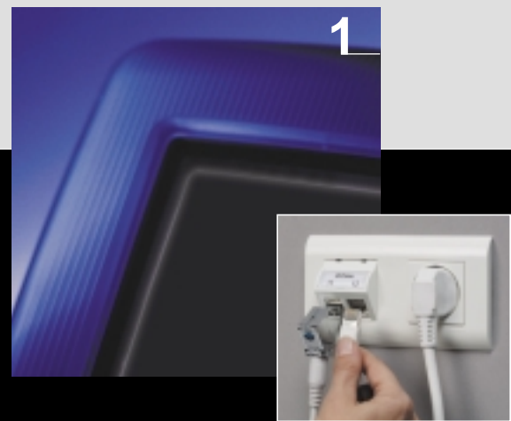
Fali aljzat (telefon-, számítógép-, videójel számára)

A SCHRACK@HOME rendszer elemei közös kalapsínre szerelhetők, ezáltal a villanszerelésnél megszokott fali elosztószekrénybe szerelhetők. Az elosztók elhelyezhetők falon kívül, ill. fali fülkébe sülyesztetten. A szekrények minden esetben biztosítják a kábelek egyszerű és kultúrált vezetése az elosztón belül amellet, hogy a hálózati elemek csatlakozófelülete könnyen hozzáférhető.