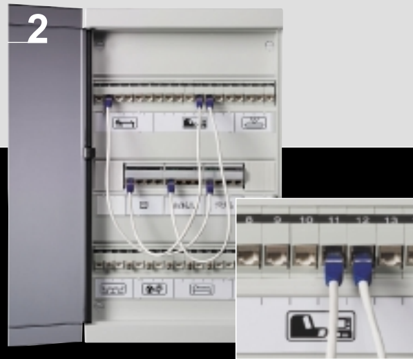
Fali elosztó szekrény a rendszer elemei számára