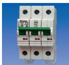
MCB kismegszakítók 10kA*